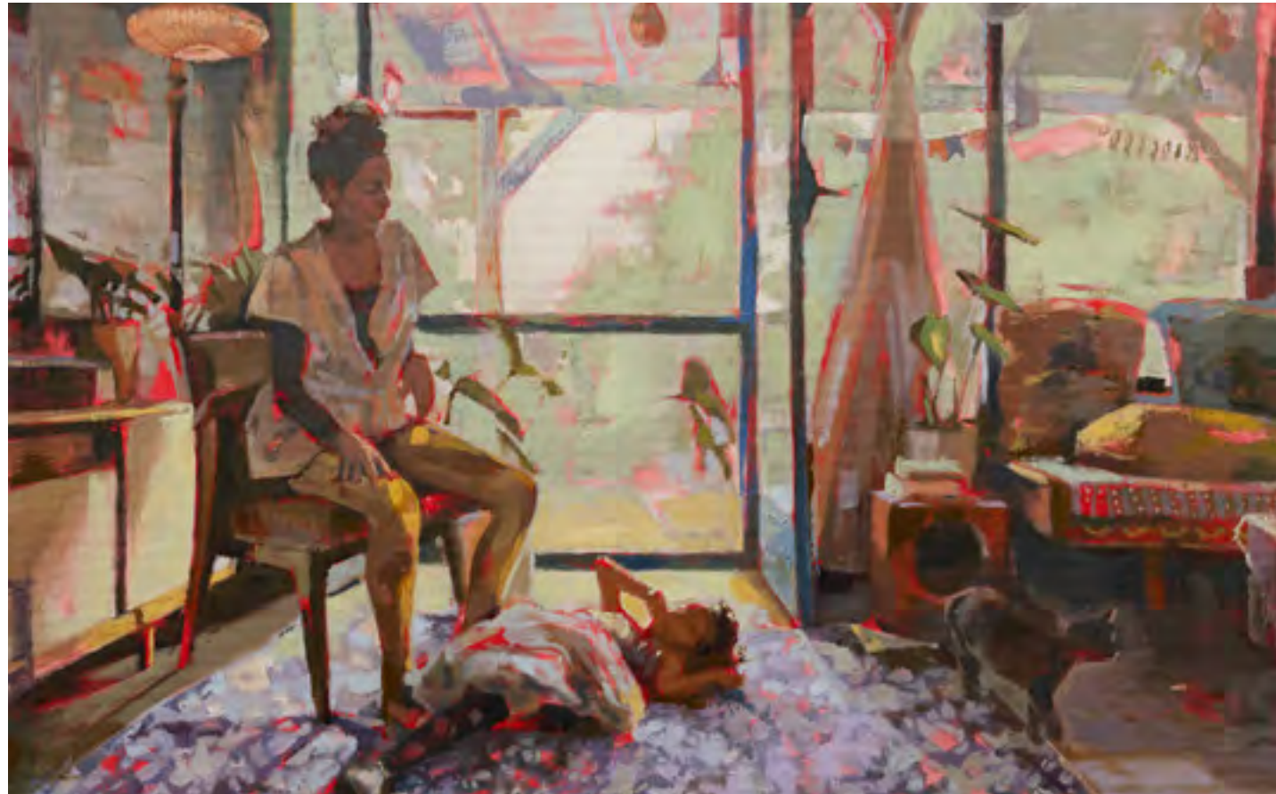
ציור: עיל דרייזין רב